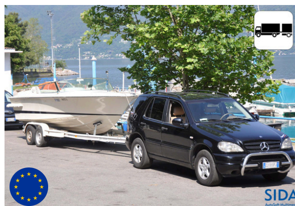
AUTOVETTURA CON RIMORCHIO NON LEGGERO FINO AD UN MAX DI 7.000KG (peso auto+rimorchio)