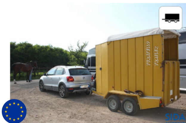
AUTOVETTURA CON RIMORCHIO - MASSA COMPLESSIVA del COMPLESSO VEICOLI FINO A 7.000 KG (RIMORCHIO PER TRASPORTO ANIMALI)

Con la patente BE sono conducibili TUTTI I VEICOLI PREVISTI dalla PATENTE DI CAT. B oltre a: