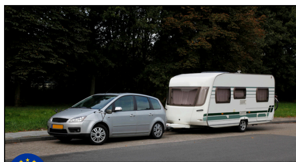
AUTOVETTURA CON ROULOTTE A TRAINO MAX DI 7.000 KG (peso auto+rimorchio)